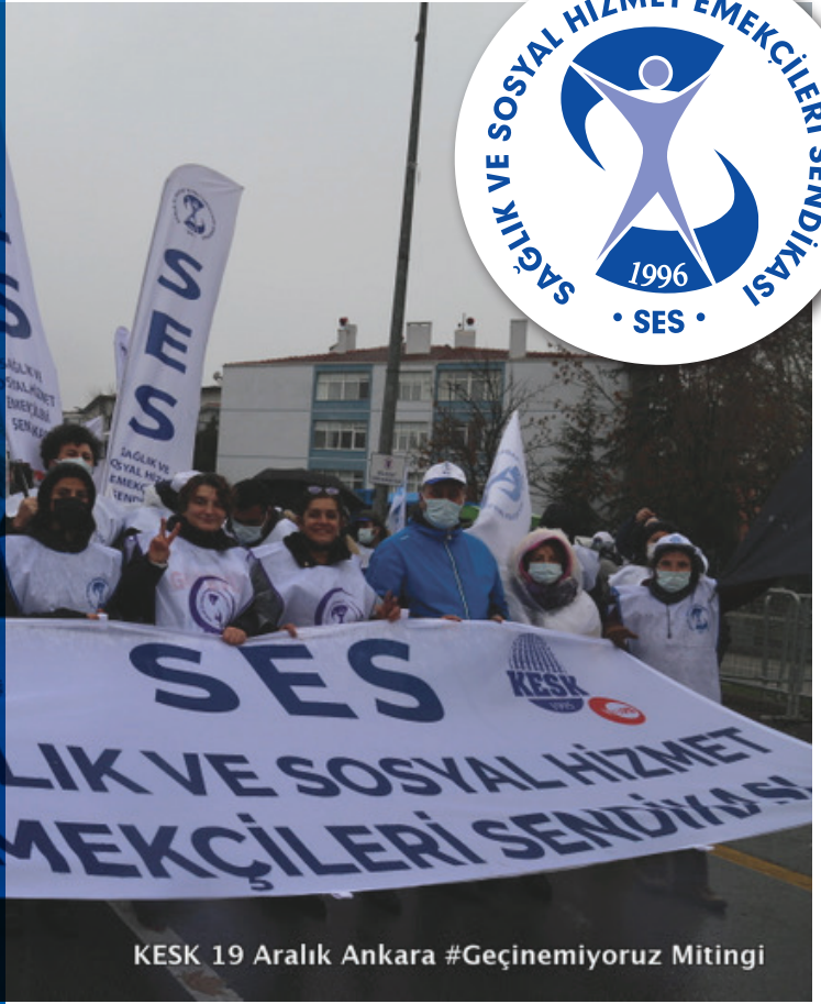
KESK 19 Aralık Ankara #Geçinemiyoruz Mitingi

ALO 184 SABİM gibi popülizme hizmet eden düzenlemelerle mesleklerimiz itibarsızlaştırıldı, bizler değersizleştirildik. Sağlık alanındaki bu uygulamalar birbirimize karşı duyduğumuz güvenin azalmasına, ekip ruhunun aşınmasına, iş barışının bozulmasına yol açtı. Ayrıca bu durum sadece bizi değil ailelerimizi ve sosyal çevremizi