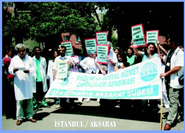
İSTANBUL / AKSARAY

Bugüne kadar bazı üniversite hastaneleri dışındaki tüm yataklı tedavi kurumlarında yemekler sağlık emekçilerine ücretsiz verilmekte idi. Her şeyi paraya tahvil etmekle övünen Maliye Bakanı, günün 24 saati çalışan sağlık emekçilerinin, bu süre içinde yiyecekleri öğle yemeğine de göz dikti ve katkı payı alınması için yazı yayınladı.