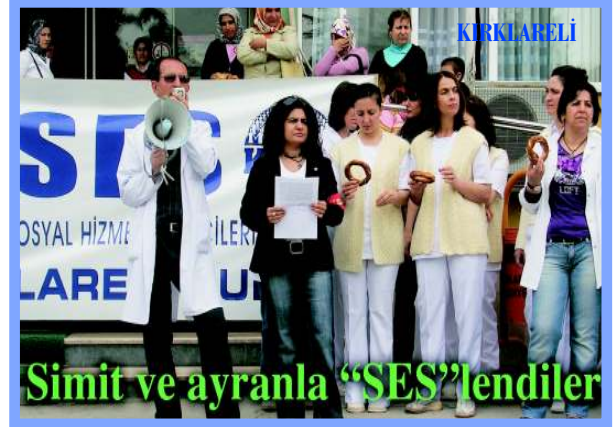
Simit ve ayranla "SES"lendiler

Ücretsiz yemek hakkımızdan vazgeçmeyeceğiz.